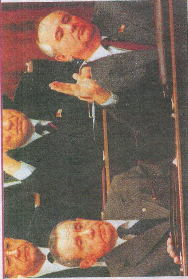
Na snímke z roku 1988 je Andrej Gromyko so šéfom Kremľa Michailom Gorbačovom.

Bol to John F. Kennedy, ktorý vtedy ako americký novinar urobil rozhovor s Gromykom.