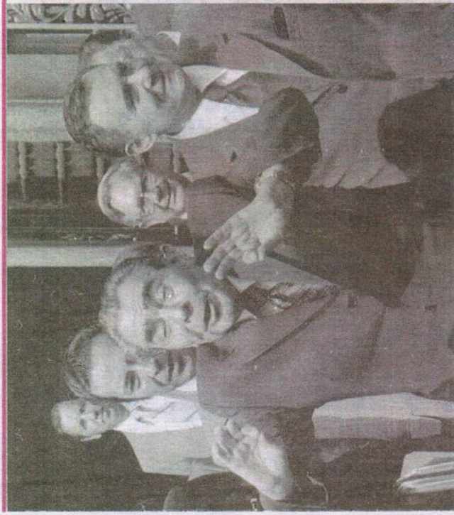
Gromyko (vpravo v popredí) v roku 1975 v Helsinkách s gestikulujúcim sovietskym lídrom Leonidom Brežnevom.