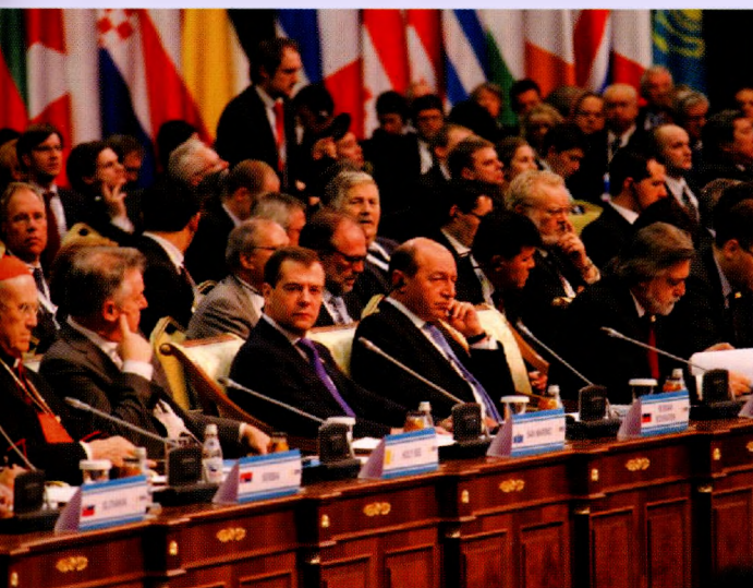
Главы государств и правительств на встрече ОБСЕ на высшем уровне, Астана, 1 декабря 2010 г.

The Charter of Paris has provided an important impetus for promoting arms control and disarmament. Even before its signing, during the Meeting, on November 19, 1990, the Conventional Armed Forces in Europe (CFE) Treaty was signed, which was negotiated within the framework of the CSCE. It was followed by a huge reduction in armaments on both sides. Then, in March 1992, 23 member countries of the Meeting signed the Treaty on Open Skies, which entered into force in 2002 and already had 33 participants. The latter, unlike the CFE Treaty, was still in effect, although it is living out its last days (until November 22, 2020). However, all these gains of the OSCE peacekeeping activity have already been almost completely erased. The CFE Treaty has long become a thing of the past after none of the NATO countries ratified it. The Trump administration,