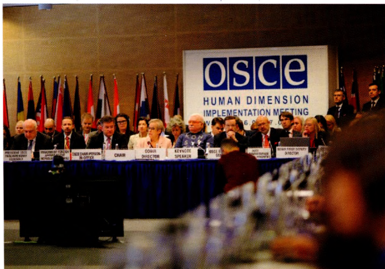
Пленарное заседание, посвящённое открытию Совещания по рассмотрению выполнения обязательств в области человеческого измерения ОБСЕ (СРВЧИ). Варшава, 16 сентября 2019 г.

Интересную метаморфозу претерпели формулировки и принципы Заключительного акта в Хельсинки в тексте Парижской хартии. Мало того что там вопросы социальной справедливости были соподчинены условиям политических реформ и внедрению рыночной экономики, но теперь речь шла об обязательствах «более глубокой интеграции <...> в международную экономическую и финансовую систему». Опять же риторический вопрос: на каких условиях СССР и другим близким ему странам предлагалось заниматься этой интеграцией