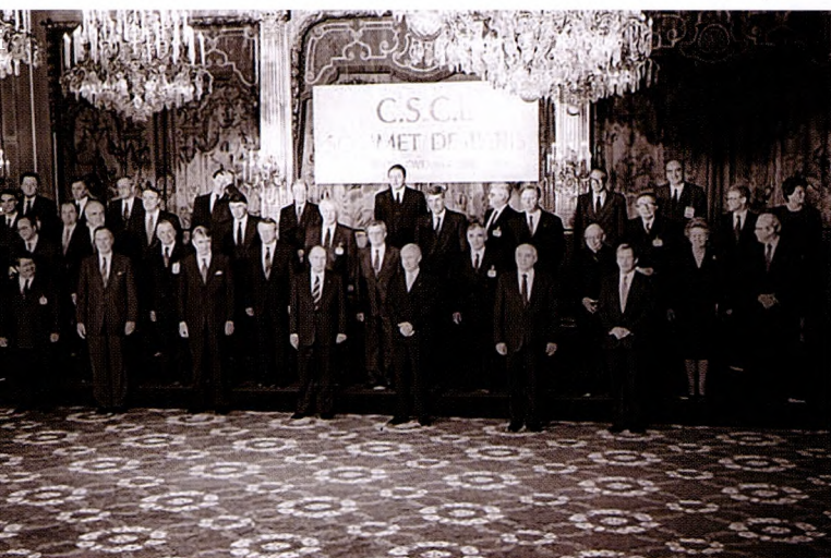
Главы государств и правительств принимают участие во Втором саммите СБСЕ в Париже, 19-21 ноября 1990 г.

Heads of State and Government take part in the Second CSCE Summit in Paris, 19-21 November 1990.