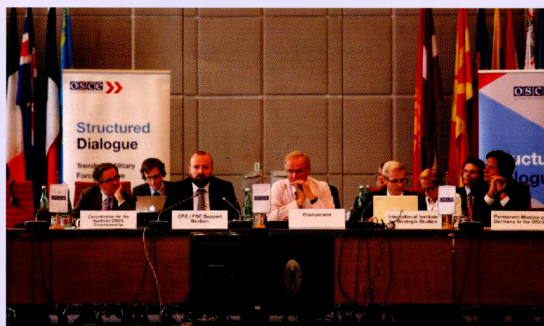
Участники последнего этапа заседания ОБСЕ по структурированному диалогу на тему актуальных и будущих проблем безопасности, 6 июня 2017 г., Вена.

Heads of States and Governments at the OSCE Summit, Astana, December 1, 2010.