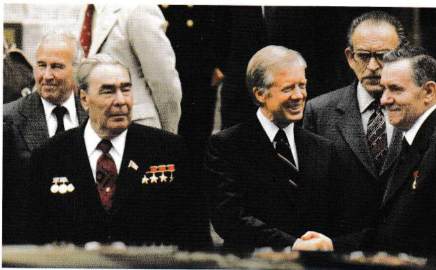
Леонид Брежнев, Джимми Картер и Андрей Громыко

Особое впечатление произвели на него «Одиссея» в переводе Жуковского и «Илиада» в переводе Гнедича. Гомер помог ему полюбить живопись.