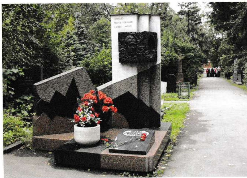
Надгробие на могиле Андрея Андреевича Громыко на Новодевичьем кладбище в Москве