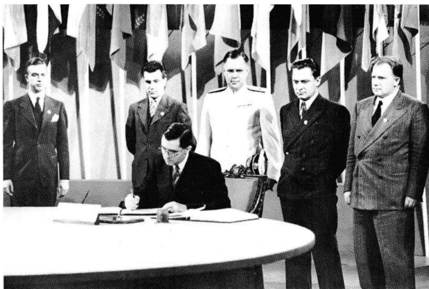
Андрей Громыко подписывает Устав ООН

Став министром иностранных дел, и особенно после избрания первым секретарем ЦК КПСС