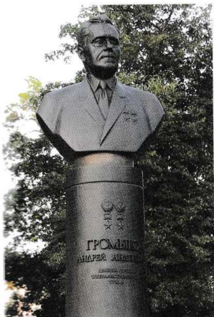
Памятник Громыко в г. Гомеле

В Великую Отечественную погибли два младших брата Громыко – Фёдор и Алексей. В честь послед-