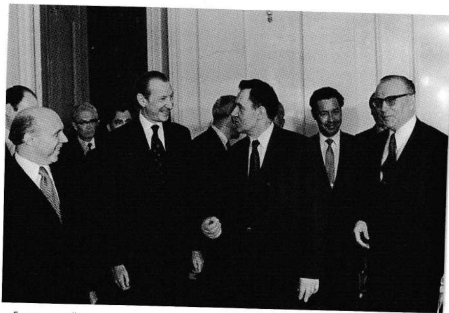
Генеральный секретарь Организации Объединённых Наций Курт Вальдхайм во время приема у министра иностранных дел СССР А.А. Громыко. Москва, 18 июля 1972 года

Чтение и любовь к нему сыграли в жизни Андрея Андреевича огромную роль. Чтобы достать интересные его книги, для него было обычным делом преодолеть расстояние и в 30, и в 40 километров. За книгами он ходил в соседние деревни, сёла, в центр волости. По его словам, он «глотал книги». Это были, например, произведение немецкого учёного Вильгельма Бёльше «Любовь к природе», работы историка М.Н. Покровского, рассказы о путешествиях Джеймса Кука, произведения Пушкина, Гончарова, Тургенева, Гоголя. Громыко вспоминал, что мог цитировать отдельные страницы книг.