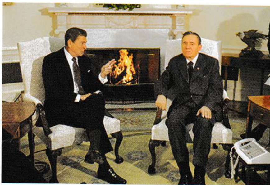
Рональд Рейган и Андрей Громыко на переговорах в Белом доме

Что касается нелёгкого физического труда, то Андрей Андреевич приобщился к нему в возрасте 7–8 лет. Трудился в основном в поле вместе с отцом и матерью. В конце жизни он поблагодарит те сложные обстоятельства детства, которые формировали его характер. Староверами и их судьбой он будет интересоваться всю жизнь. Вспоминаю,