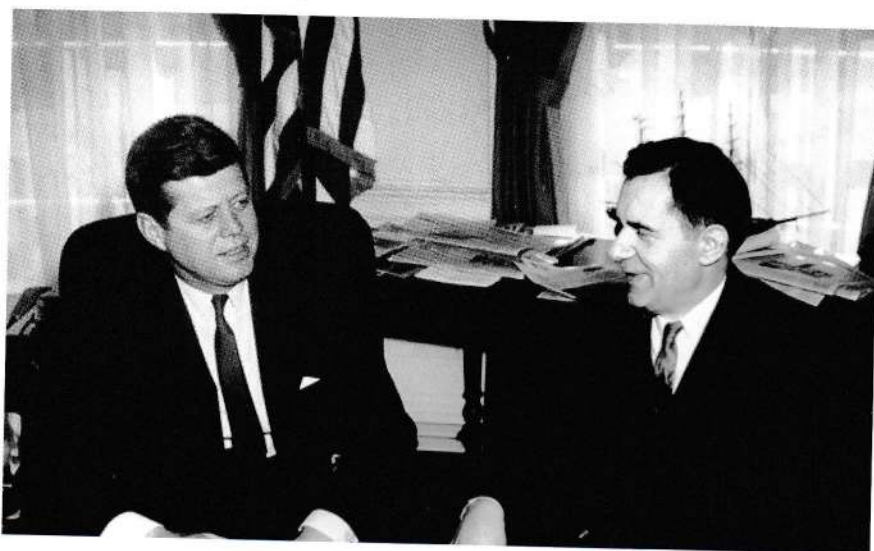
Джон Кеннеди и Андрей Громыко

Л.И. Брежнев в 1964 году, Громыко сделал многое, чтобы оградить советскую дипломатию от чрезмерного влияния идеологии, делая упор в работе с иностранными партнёрами на реализм, прагматизм и выработку взаимоприемлемых компромиссов. С максимальной силой это проявилось в 1973 году, когда он стал членом Политбюро. По большому кругу вопросов, в первую очередь относящихся к капиталистическим странам, Громыко минимизировал влияние на внешнюю политику аппарата ЦК.