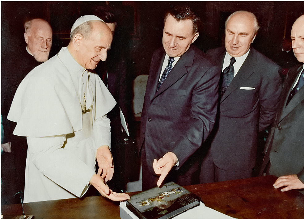
Подарок Папе Римскому Павлу VI, 1974 год

Андреевич не раз и в семейном кругу, и публично подчёркивал вклад православия и вообще христианства в развитие мировой цивилизации. Делал он это и в качестве председателя Президиума Верховного совета СССР в дни празднования 1000-летия христианства на Руси.