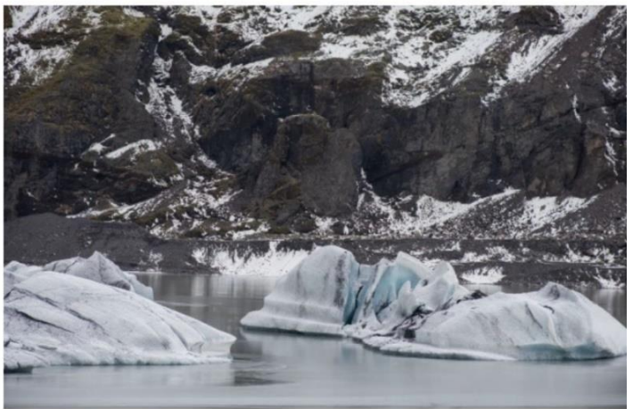
Международный экспертный совет по сотрудничеству в Арктике, 2022