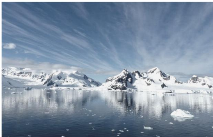
Международный экспертный совет по сотрудничеству в Арктике, 2020